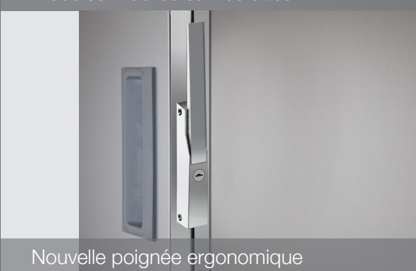
Nouvelle poignée ergonomique