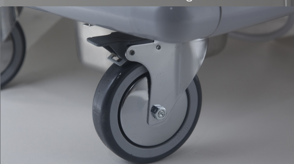
Modèles mobiles sur roulettes