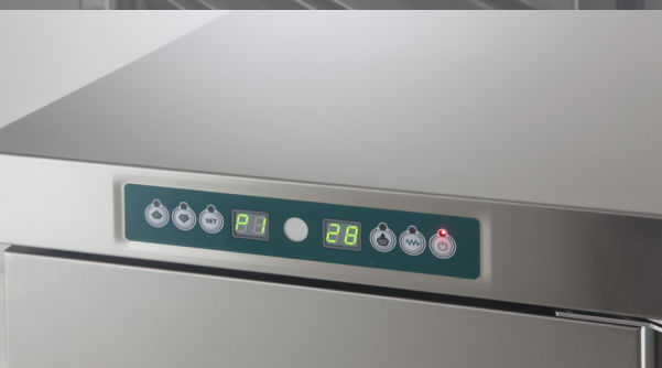
Panneau de commande digital